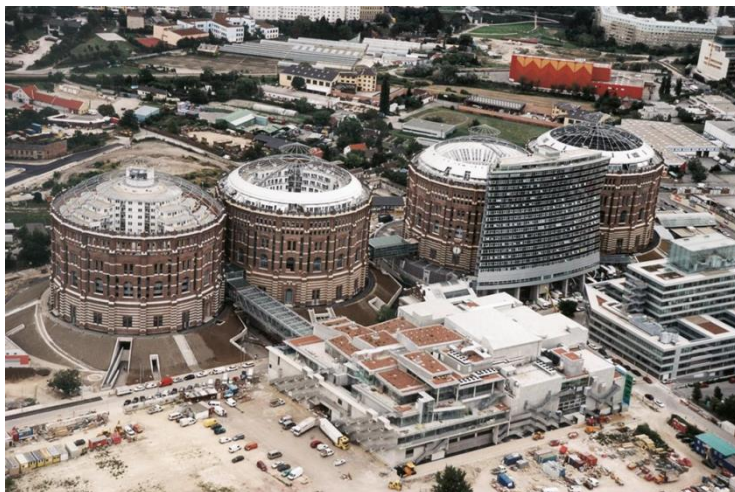
Рисунок 2 – Газометр-Сити, Вена. Архитекторы: М. Ведорн, Ж. Нувель, К. Химмельблау, В. Хольцбауэр. 2001г.

Газометры в Вене – 4 бывших газголлера в Вене и построенные в 1896-1899 годах. 1969-1978 перестали функционировать и были закрыты. В 1999-2001 годах они были переделанные и стали многофункциональными комплексами.