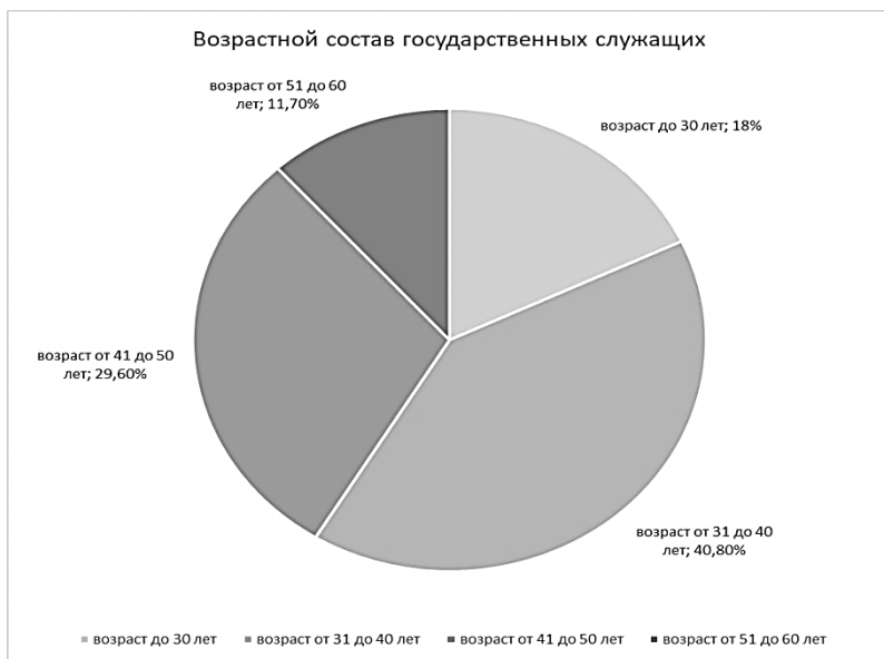
Рисунок 3 – Возрастной состав государственных служащих [1]

В Министерстве государственных служащих от 51 до 60 лет – 11,7%. Количество служащих в среднем возрасте от 31 до 40 лет – 40,8%.