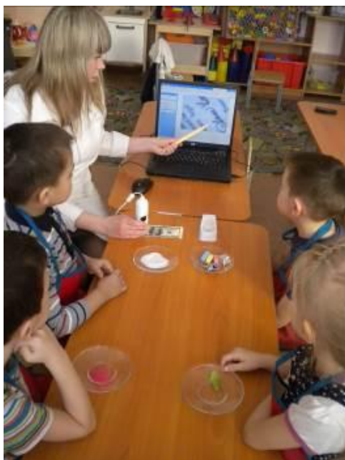
Рисунок 1 – Занятие с микроскопом по подгруппам