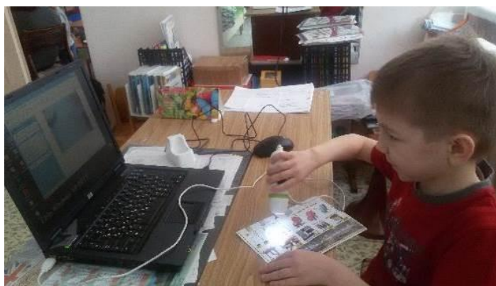
Рисунок 2 – Самостоятельная экспериментальная деятельность